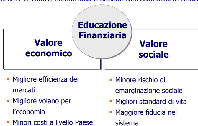
Figura 1. Il valore economico e sociale dell'educazione finanziaria